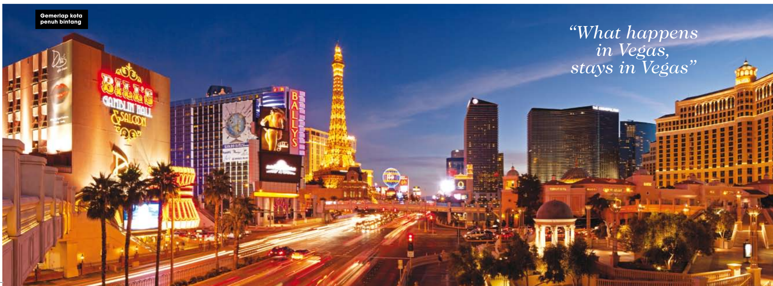
Gemerlap kota penuh bintang